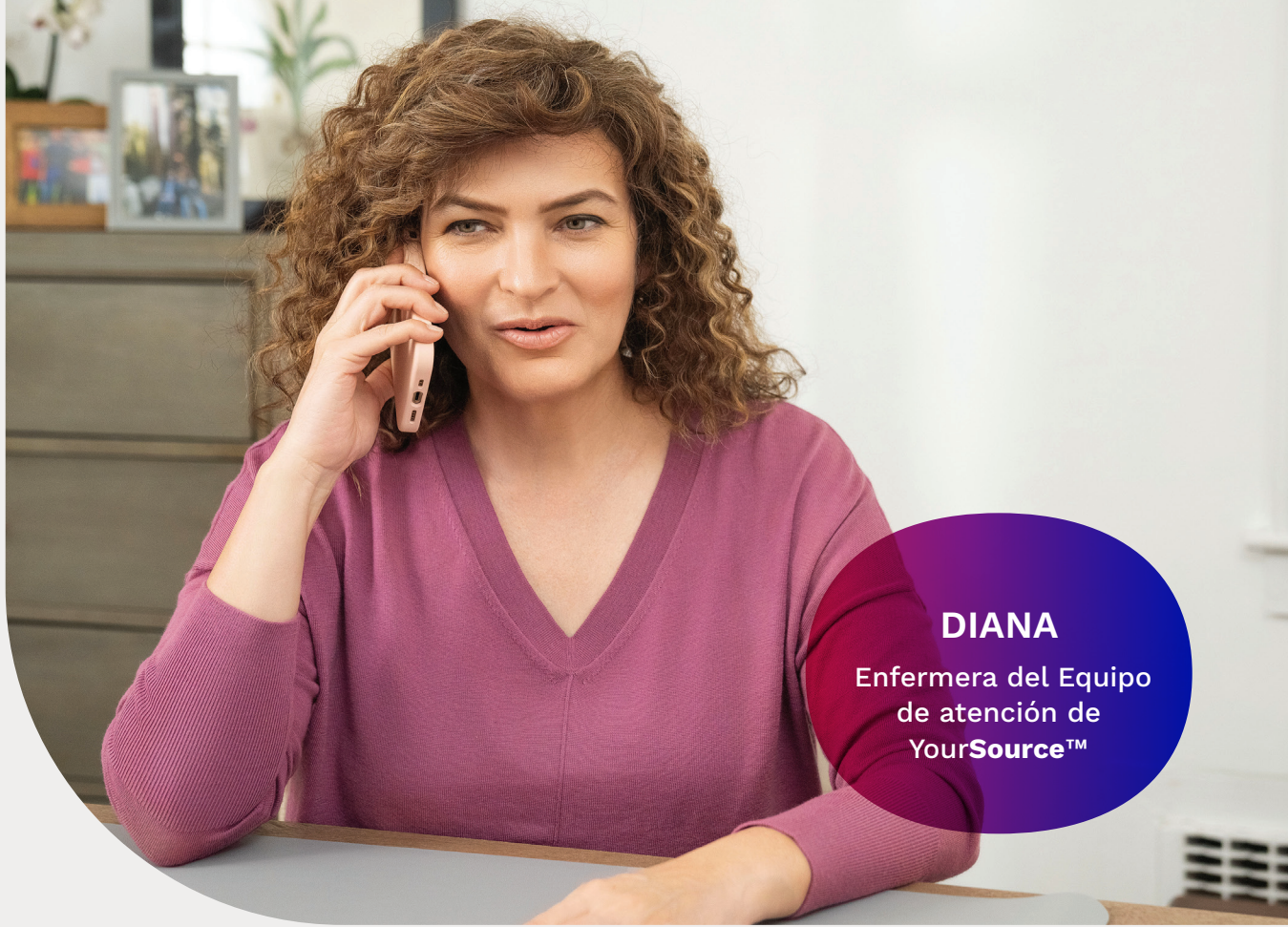
DIANA Enfermera del Equipo de atención de YourSource™